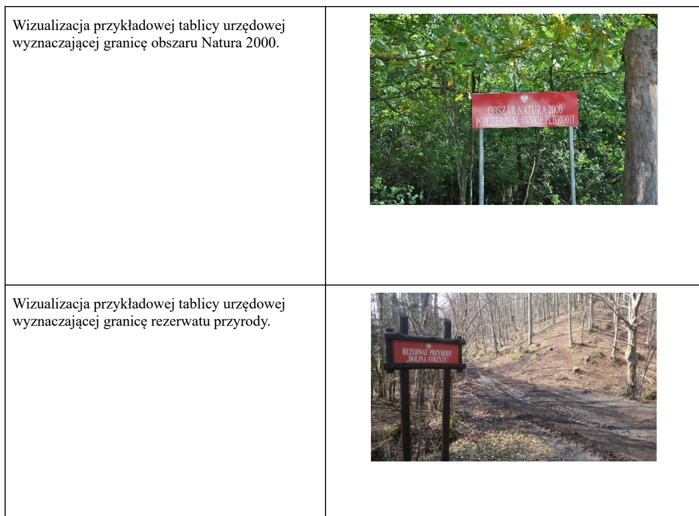
Tabela 2. Przykładowa wizualizacja tablic.